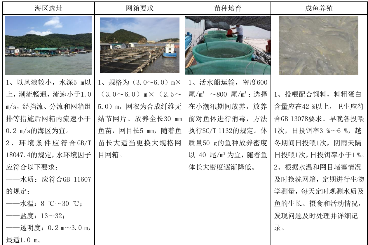
表B.1 黄姑鱼养殖技术模式图